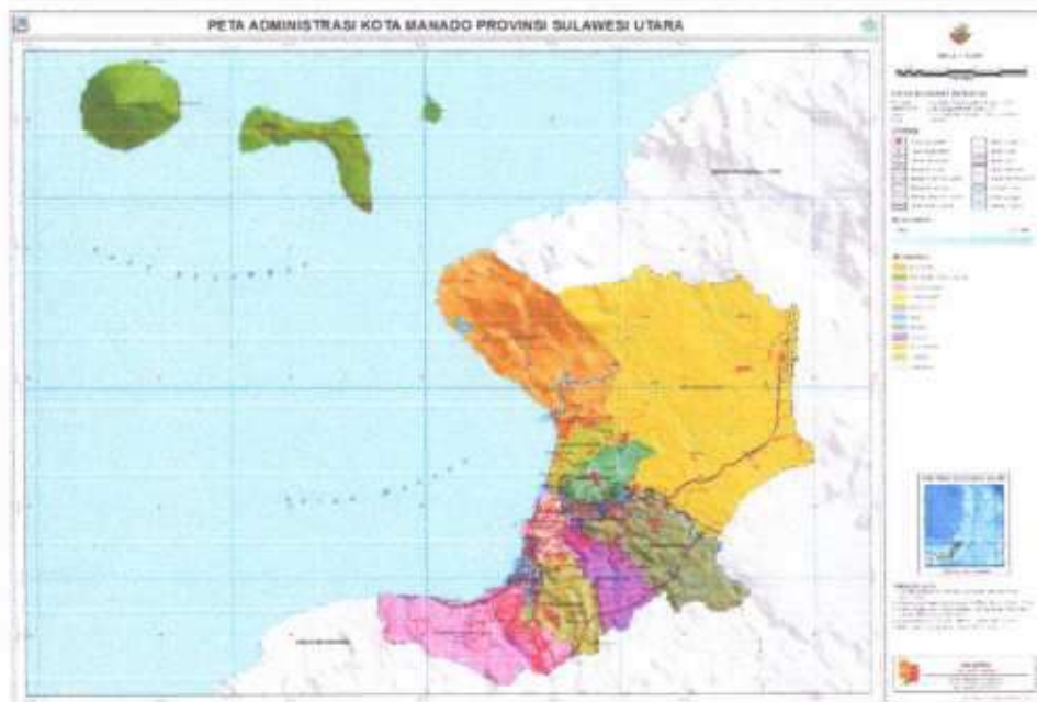
Gambar 1 Peta Administrasi Kota Manado